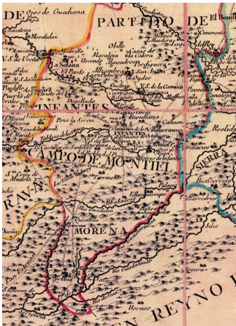
Fig. 3: Mapa de la Provincia de la Mancha y sus partidos, año 1765. Detalle del partido del Campo de Montiel.

El río de Guadiana que se lleva mencionado y que se introduce en dicho termino por el Molino de Losero, entran sus aguas en la laguna llamada del Consejo, propia de dicha villa. Y como a veinte pasos del molino hay un cuarto casa de campo que llaman también del Losero. Corriendo la vertiente abajo y a la dere-